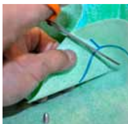
7. Klipp upp och skär bort överflödigt KeraSafe material i innerhörnet. Tryck fast i det blöta limmet.