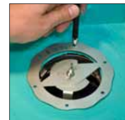
8. Märk ut skruvhålen efter skärmallen och gör sedan hål.