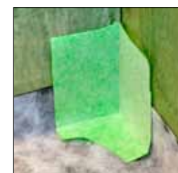
4. Klipp till och anpassa ett KeraSafe innerhörn enligt bilden. Montera hörnet med Kiilto K2 Tätskikt.