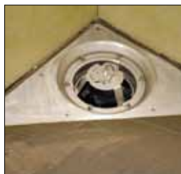
2. Sätt i Blücher skärmall i brunnen.