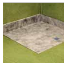
3. Montera brunnsmanschett över brunnen med ett uppvik på 5 cm på vägg.