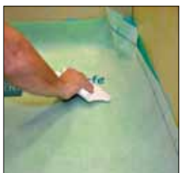
6. Montera KeraSafe väden över golvet och brunnen och pressa ut blåsorna så att väden sitter fast.