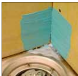
3. Klipp till ett KeraSafe innerhörn och limma väggen med Kiilto K2 Tätskikt och brunnen med KeraSeal.