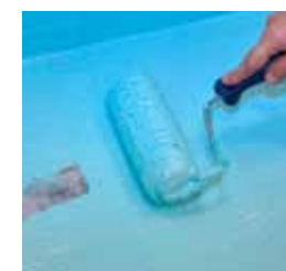
6. Applicera sedan Kiilto K2 Tätskikt över hela ytan 2x500g.