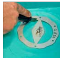
7. Vänta till dagen efter, skär sedan hål för brunnen efter skärmallen.