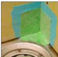
4. Montera KeraSafe innerhörn i det blöta limmet och tryck fast.