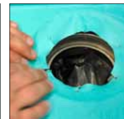
9. Ta ur skärmallen och tryck fast manschett ner i brunnen.