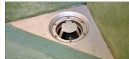
2. Sätt i skärmallen i brunnen.