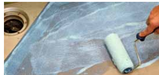
1. Applicera Kiilto K1 Ångspärr 2 x 100g, inte ut på brunnen med ca 1 timmes mellanrum. Låt torka.

Börja med att ta bort klämringen och gör sedan rent brunnen och torka av den med rödsprit. Slipa med fint sandpapper typ 100 korn.