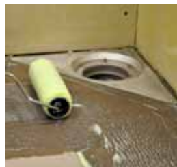
1. Prima golvet med Keraprimer men inte ut på brunnen. Låt torka.

Vid montering av väggnära brunnar med KeraSafe Folie System ska man alltid börja med att lägga första väden på golvet vid brunnen och göra ett uppvik på respektive vägg med 10 cm