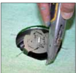
10. Snitta upp KeraSafe väden från makeringen in mot mitten.