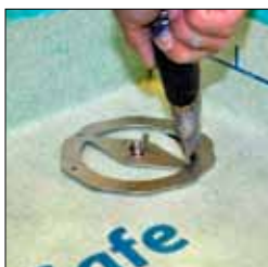
8. Vänta till dagen efter, skär sedan hål för brunnen efter skärmallen.