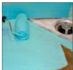
5. Limma brunnsflänsen och hörnet med KeraSeal, övriga golvet och uppviket med Kiilto K2 Tätskikt.