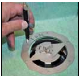
9. Märk ut skruvhålen efter skärmallen.