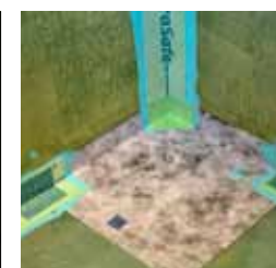
5. Montera övriga KeraSafe remsor med Kiilto K2 Tätskikt.