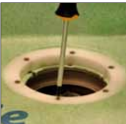
12. Montera klämringen. Skruvarna dras fast diagonalt. Alla skarvar och uppvik limmas med KeraSeal. Följ därefter gällande monteringsanvisning.