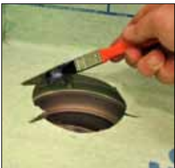
11. Limma sedan KeraSeal på brunnsidorna innan klämringen monteras.